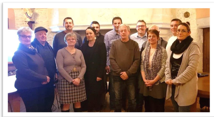
L'EQUIPE DES BENEVOLES DU COMITE DES FETES VOUS SOUHAITE UNE TRES BONNE ANNEE 2019

Si vous souhaitez vous joindre à nous pour étoffer notre équipe, vous êtes les bienvenus. Vous pouvez nous contacter au 02.54.25.86.10 (Claudine Tissier).