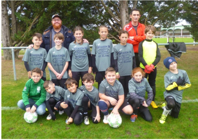
L'EQUIPE U11 DE L'ECOLE DE FOOTBALL

L'EPCC souhaite à tous les lecteurs de ce bulletin une excellente année 2019 remplie de joie, de réussite et surtout de santé.