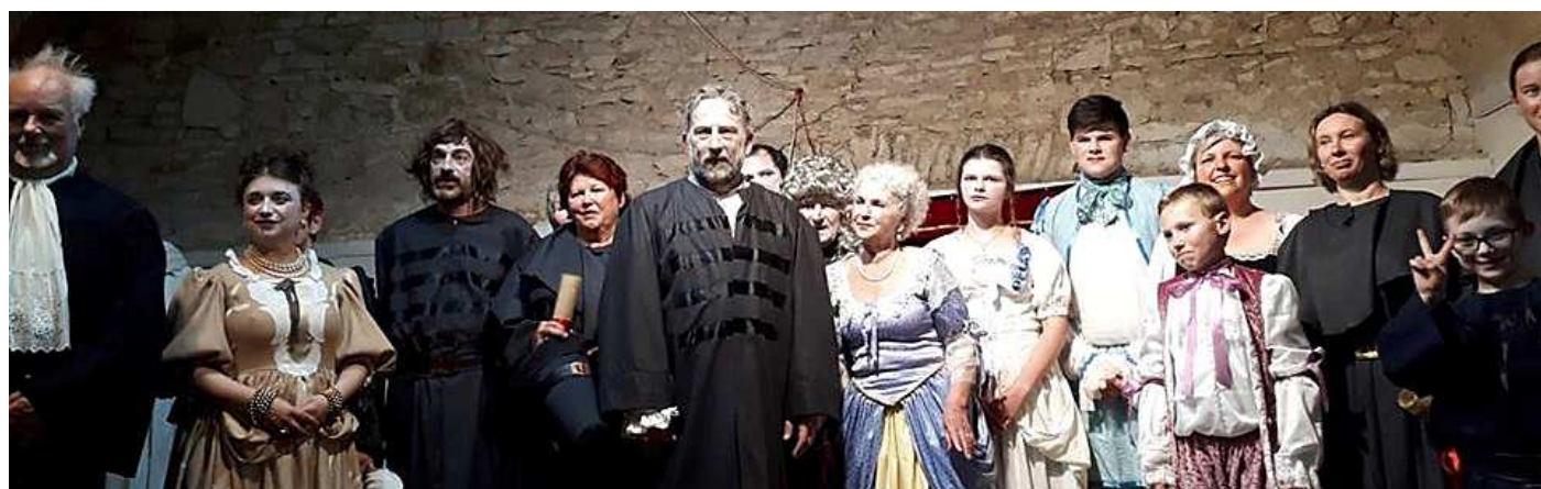
LA TROUPE DE LA "COMPAGNIE DU CHÂTEAU" POUR L'AVANT 1ERE DU MALADE IMAGINAIRE AU CHATEAU DE CHABENET

COTISATION : 15 euros/famille ou 10 euros/personne seule